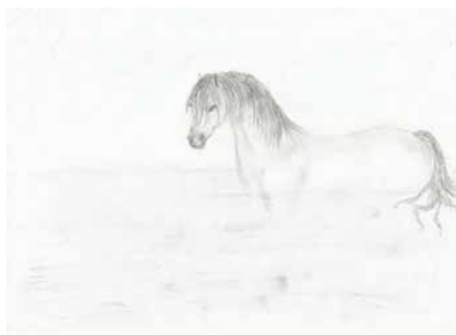
Rys. wyk. Przez Natalię Kowalczyk