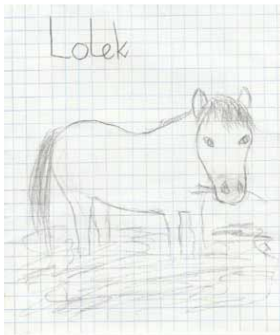
Rys. wykonany przez gr. P. Magdy