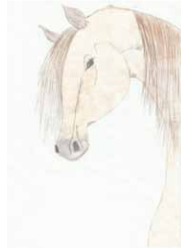
Rys. wyk. Przez Anię Siwiarek

Grzesiu, o Grzesiu, Grzesiu nasz stajenny.