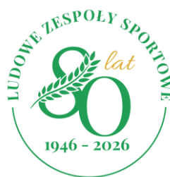
SW LZS Katowice